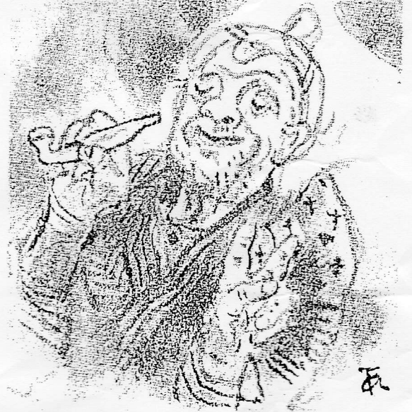
「町田の民話と伝承 第二集」より