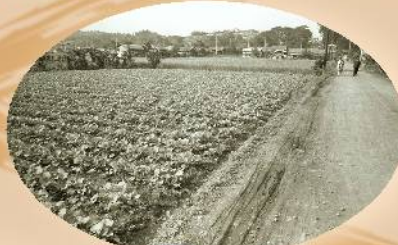
諏訪神社南側の畑