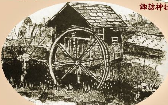
中相原青年の水車