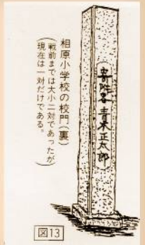
相原小学校の校門(重) 現在は対だけである。