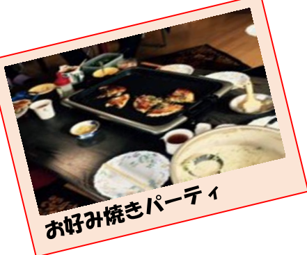
お好み焼きパーティ