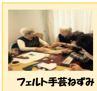
フェルト手芸ねずみ