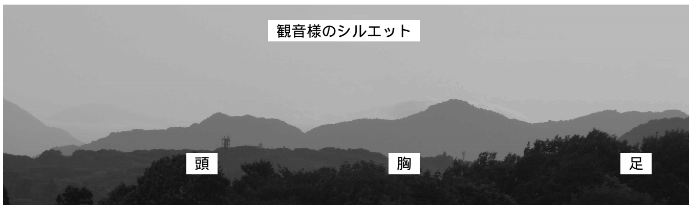
観音様のシルエット